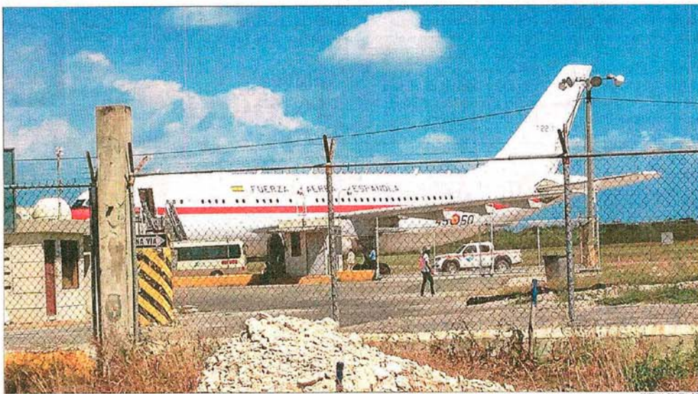
En tierra. El Airbus 310 que suele utilizar el Príncipe en sus desplazamientos, fotografiado ayer en Santo Domingo

• Piqué, Pedro y Alexis marcaron los tantos azulgrana DEPORTES 40 A 44