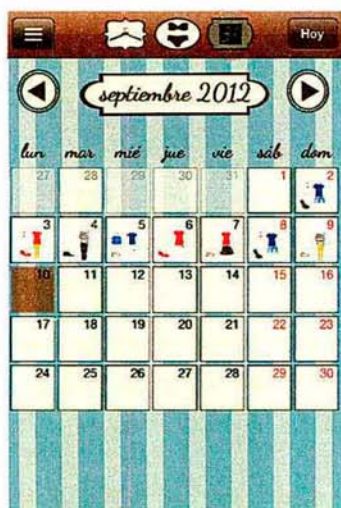
DRESSAPP APP PARA TENER EL ARMARIO CLASIFICADO EN EL SMARTPHONE. WWW.DRESSAPP.ES