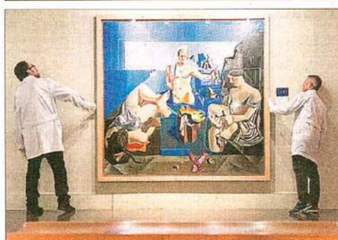
Academia neocubista, un Dalí de Montserrat que viaja a Italia

Montserrat acapara colecciones artísticas familiares