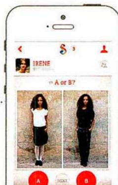
SHAREIFASHION APP DE MODA PARA INDECISOS DE SU LOOK. WWW.SHAREIFASHION.COM